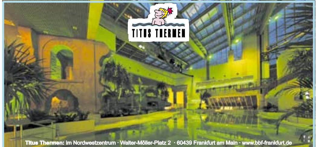
Titus Thermen: im Nordwestzentrum · Walter-Möller-Platz 2 · 60439 Frankfurt am Main · www.bbf-frankfurt.de

Das Sportbecken wurde durch eine Edelstahlwanne wasserdicht gemacht. Teure Wasserverluste gehören somit der Vergangenheit an. Dazu gibt's, wie früher: das flache Erlebnisbecken – auch für Nichtschwimmer und Gymnastikfreunde – mit Strömungskanal, Wand- und Bodensprudlern, ein Babybecken mit Elefantenrutsche und für die größeren Kinder eine 50 Meter lange Rutsche ins Abenteuerbecken mit Wasserfall und Grotte. Dazu Whirlpools (Sprudelbecken),