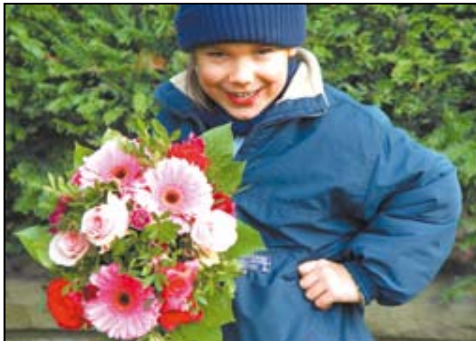
Hallo Mama, habe ich Dir heute schon gesagt, daß ich Dich liebe habe?

Und im Zentrum dieser ganzen Maischwärmereien steht der Muttertag. Auch dies ein Tag