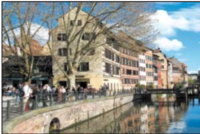
Malerisch liegen die alten Fachwerkhäuser im Gerberviertel an der Ill.

Straßburg ist aber auch die Stadt der Museen und Kirchen, mit einer malerischen Altstadt rund um das berühmte Münster. So bevölkern zahllose Besucher aus Nah und Fern selbst an einem wettermäßig durchwachsenen Apriltag die rund 260.000 Einwohner große Stadt. Wichtigstes Ziel ist das Liebfrauenmünster. Der Grundstein für dieses Meisterwerk der Gotik wurde 1015 gelegt. 1439 wurde der 142 Meter hohe Turm vollendet. Den zweiten Turm hat das Straßburger Münster bekanntlich bis heute nicht erhalten. 329 Stufen führen, bei einem Eintritt von 4,60 Euro, auf die Aussichtsplattform. Von dort aus bietet sich ein einmaliger Ausblick nicht nur auf die Stadt. Bei schönem Wetter blickt man Richtig Osten auf den Schwarzwald und nach Westen auf die Vogesen. – Im Münster ist die Astronomische Uhr mit ihrem