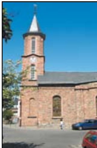
Die Evangelischen Kirche in Alt-Hausen.

Die Kinderkirche ist ein Angebot für Kinder im Alter von 3 bis 10 Jahren mit Ihren Eltern oder Begleitpersonen. Ein Team von Frauen aus dem Kirchenvorstand gestaltet die Treffen gemeinsam mit Pfarrer Holger Wilhelm. - Ökumenischer Familienkreis mit der katholischen