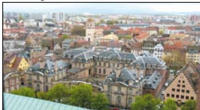
Der Rohan-Palast vom Straßburger Münster aus gesehen.

Wer mehr über Straßburg erfahren möchte, da hier nicht alle Sehenswürdigkeiten beschrieben werden können, dem sei die Internet-Seite www.ot-strasbourg.com empfohlen. UMK