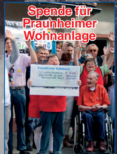
Spende für Praunheimer Wohnanlage