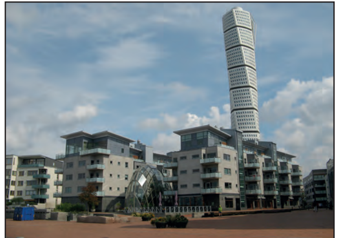
Modern und trotzdem ansprechend ist das neue Wohnviertel in Malmö mit dem 190 Meter hohen Wohnhochhaus „Gedrehter Torso“.

Dem neuen, modernen Malmö steht eine Altstadt mit zahlreichen geschlossenen Altbau-Ensembles gegenüber. Auch Kopenhagen hat davon profitiert, daß es im 2. Weltkrieg nicht zerstört wurde. Unzählige, prachtvolle Häuserfassaden kann der Besucher bewundern. Zu den zahlreichen Sehenswürdigkeiten gehören unter anderem Christiansborg, Amalienborg, der Nyhavn, natürlich die kleine Meerjungfrau und Tivoli.