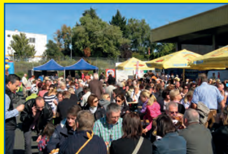
40. Rödelheimer Volksradfahren