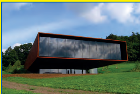
Die AWO-Hausen bei den Kelten