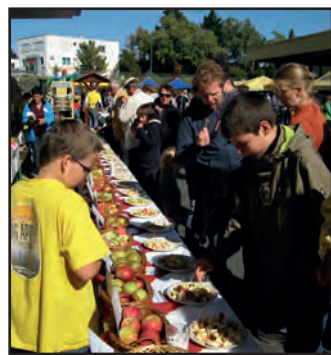
Die Apfelteststrecke aus dem letzten Jahr.

Start und Ziel befinden sich, wie immer, auf dem Hof der Kelterei in der Eschborner Landstraße 156-162. Die Startzeit ist von 10 bis 12.30 Uhr. Das Startgeld beträgt für Erwachsene 2 Euro und für Kinder 1,50 Euro. Einzige Teilnahmebedingung: Das Rad muß verkehrssicher sein. Gefahren wird nach der Straßenverkehrsordnung, zum Beispiel