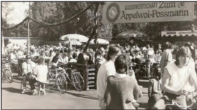
Ein Bild aus den Anfangsjahren, die Gartenwirtschaft noch ohne Dach.

Zum diesjährigen 40. Jubiläum des Volksradfahrens darf man sich bereits am Freitag, den 26. September, um 20 Uhr, auf etwas ganz besonderes freuen. Die Frankfurter Gypsies treten Live auf dem Gelände der Kelterei in Rödelheim auf und starten somit die große Jubiläumsfeier mit jeder Menge Musik und Stimmung. Tickets können direkt über die Kelterei bezogen werden.