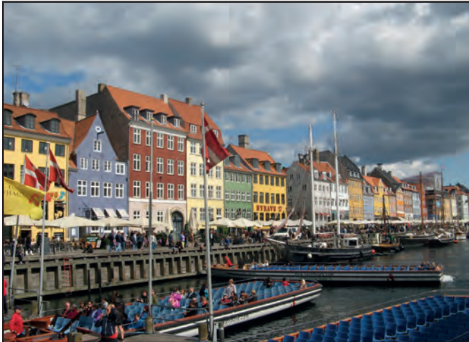
Der Nyhavn mit seinen bunten Giebelhäusern ist Kopenhagens bekanntes Kneipenviertel, welches sich wie ein langes Restaurant am Hafenbecken entlang zieht.

Wer an die Boom-Regionen Europas denkt, mag die dänische Hauptstadt vielleicht übersehen. Doch Kopenhagen zählt zweifelsfrei dazu und eine Städtereise dorthin ist auf jeden Fall lohnenswert. Nördlich der 550.000 Einwohner großen Stadt liegt eines der teuersten Wohngebiete Europas. Kürzlich hat das dänische Thronfolgerpaar dort „Quartier“ bezogen. Die Wirtschaft wächst auch deswegen, weil das süd-schwedische Malmö (315.000 Einwohner) und Kopenhagen seit 2000 durch eine Brücke ver-