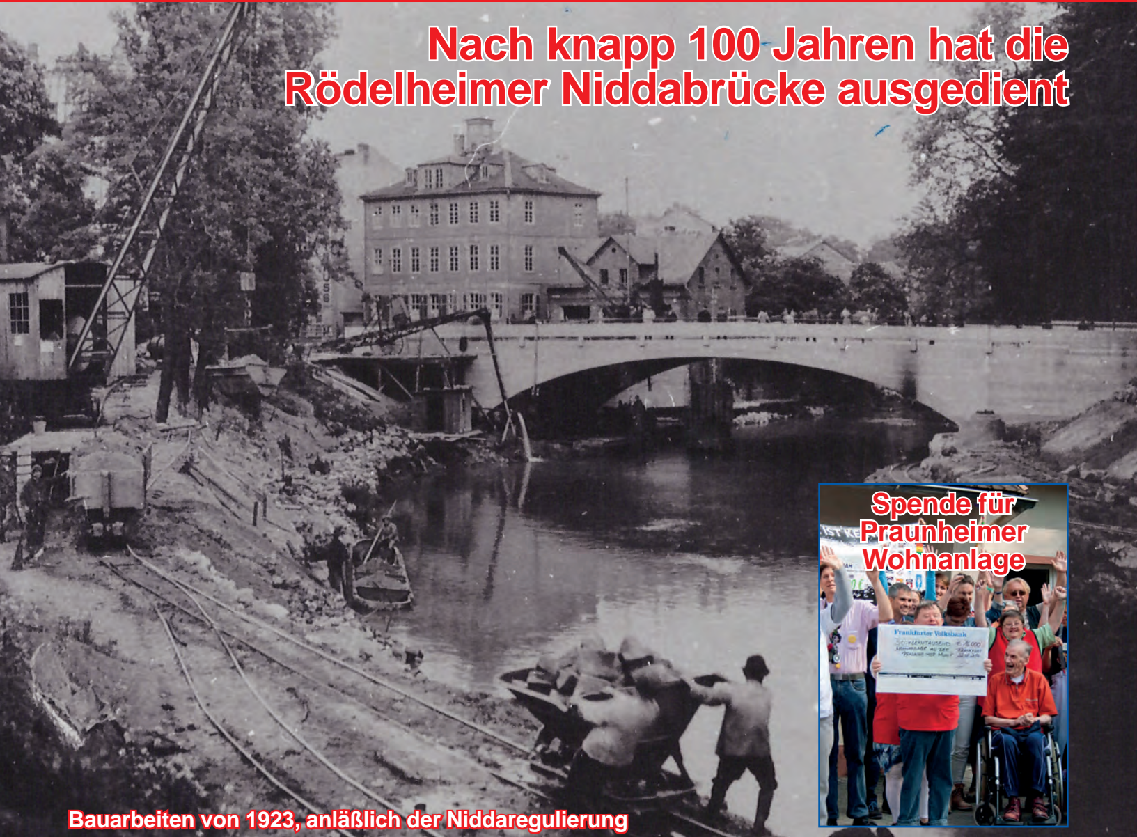
Bauarbeiten von 1923, anlässlich der Niddaregulierung