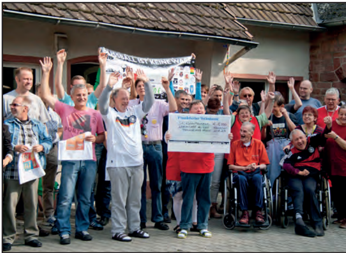
Riesige Freude bei der Scheckübergabe An der Praunheimer Mühle.

Großer Jubel herrschte im Sommer in der Wohnanlage „An der Praunheimer Mühle“ der Praunheimer Werkstätten (PW), als der Verein „Fußballer und Fans helfen e.V.“ zur Spendenübergabe eintraf. Der Verein hatte einen Scheck in Höhe von 17.000 Euro mitgebracht. Die Summe wurde beim traditionellen Benefiz-Fußballturnier erzielt, welches bereits im Mai zum sechsten Mal auf dem Sportplatz der SG Praunheim ausgetragen wurde.