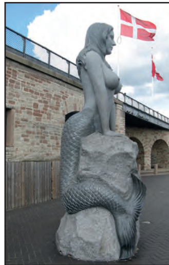
Die weltbekannte Meerjungfrau hat Konkurrenz bekommen: rechts die anmutige Bronzefigur von 1913 und links eine modernere Darstellung, die nur wenige Besucher finden.

ihre Gäste und machen den besonderen Charme des Tivolis aus. Im Sommer finden dort Konzerte statt. Zahlreiche Restaurants bie-