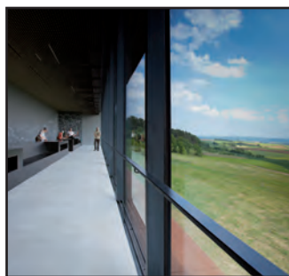
Ausblick aus den Panoramafenstern. Von vorne wirkt es wie ein Riesenfernrohr (siehe Foto auf Titelseite).

Sie ist die einzig komplett erhaltene aus dieser Zeit und wurde in einem der drei gefundenen Herrschergräber am 14.6.1996 bei den Ausgrabungen entdeckt: