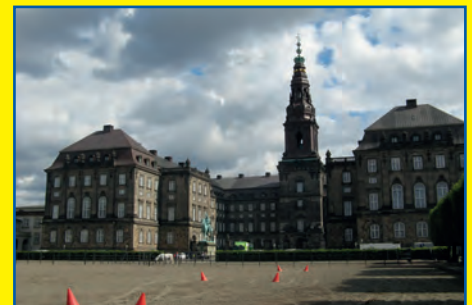
Reise-Tip: Städtereise Kopenhagen / Malmö