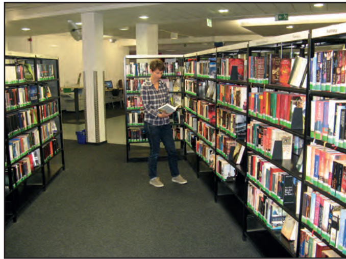
Blick in der Rödelheimer Stadtteilbibliothek.

Einen solchen Bücherstand betreibt der Förderverein auch bei den Rödelheimer Stadtteilfesten.