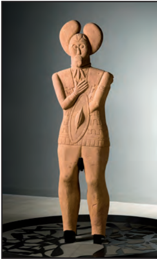
Die „Ohren“ des Keltenfürsten sind eine Mispelblattekron.